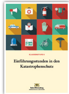
Einführungsstunden in den Katastrophenschutz für Klasse 6