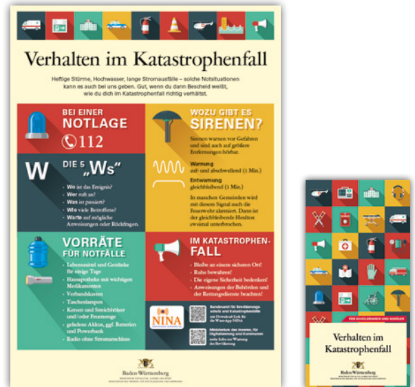
Plakat und Flyer „Verhalten im Katastrophenfall“

Zweiminütige kurze Filmclips zu einzelnen Themenfeldern, wie beispielsweise einem Stromausfall , stehen für den Unterrichtseinsatz ebenfalls zur Verfügung.