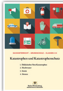
Unterrichtsbeispiele für die Grundschule