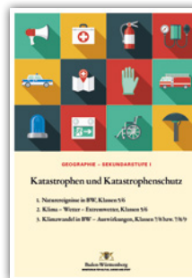
Unterrichtsbeispiele für die Sekundarstufe I und II