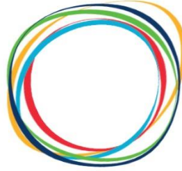
NN Regionalkoordination Schwäbisch Gmünd