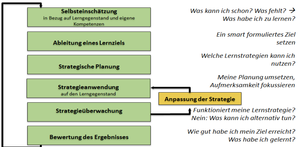
Abb. 1: Der siebenstufige Zyklus selbstregulierten Lernens (u. a. Ziegler & Stöger, 2005)

Ausgeprägte Selbstwirksamkeitserwartungen sind Voraussetzung für eine erfolgreiche Selbstregulation. Sie steuern Prozesse der Zielsetzung, Planung und Handlungsausführung und sind entscheidend für die Interpretation von Handlungsergebnissen. Insbesondere die schulische Selbstwirksamkeitserwartung wirkt sich positiv auf die Verwendung von Lernstrategien, auf die Motivation und somit auf die Schulleistung aus. Der Aufbau schulischer Selbstwirksamkeitserwartung reduziert die Prüfungsangst und vor allem die leistungsmindernde Besorgnis. Die soziale Selbstwirksamkeitserwartung spielt eine wichtige Rolle, wenn es darum geht, Gruppendruck standzuhalten, Konflikte ohne Gewalt auszutragen und sozialen Anschluss zu finden. Die allgemeine Selbstwirksamkeitserwartung stellt eine bedeutende personale Anti-Stress-Ressource bei der Bewältigung genereller Lebensanforderungen dar. Sie sollte daher gerade das psychische und physische Befinden der Schüler positiv beeinflussen. Selbstreguliertes Lernen ist ein zyklischer Prozess, der sich in sieben Schritte unterteilen lässt. Das Modell von Ziegler und Stöger (u. a. 2005) veranschaulicht, welche Schritte und handlungsleitenden Fragen zu einer erfolgreichen Lernhandlung gehören. Es bietet darüber hinaus Ansatzpunkte für die Diagnose von Schwierigkeiten im Lernprozess und für gezielte Unterstützungsmaßnahmen.