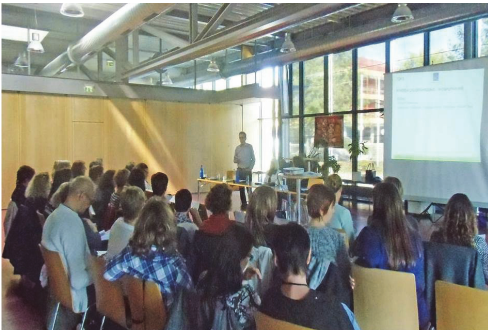
Vortrag zum Thema Elternarbeit und Erfahrungsbericht aus dem Projekt „Der Weg zum Erfolg“.