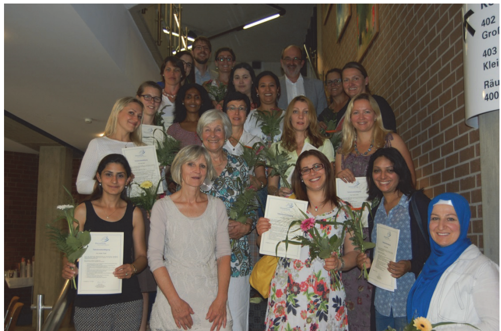
Interkulturelle Elternmentoren bekommen ihre Zertifikate überreicht.

Nach der Ausbildung war es wichtig für die Elternmentoren, eine zentrale Anlaufstelle zu haben. Diese Aufgabe übernimmt die Bildungsregion. Sie unterstützt die Elternmentoren bei Fragen zur Zusammenarbeit mit Kitas bzw. Schulen und organisiert Austauschtreffen und Fortbildungen.